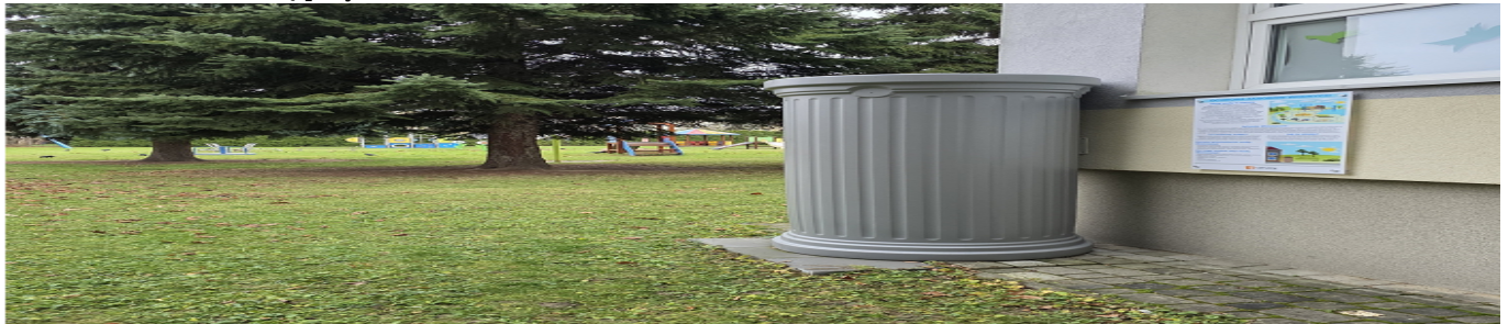
Zbiornik na deszczówkę z tablicą przy PP