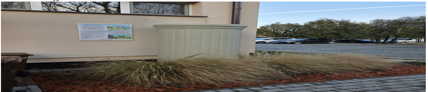
Zbiornik i tablica edukacyjna przy SP