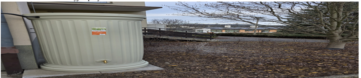
Zbiornik na deszczówkę przy DPS

Kontynuując działania związane z ochroną zasobów wodnych na terenie Miasta Rzeszowa, na przełomie listopada i grudnia zamontowano 8 nowych zbiorników na deszczówkę przy placówkach organizacyjnych Urzędu Miasta Rzeszowa - szkołach, przedszkolach i domach pomocy społecznej.