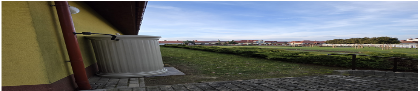
Zbiornik na deszczówkę przy DPS