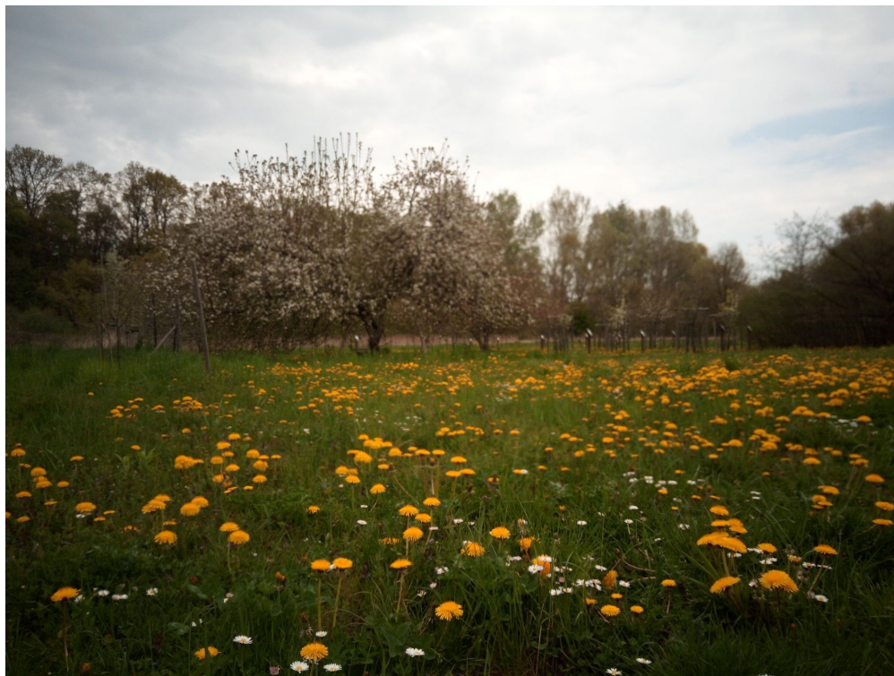
Sad przy rezerwacie Lisia Góra