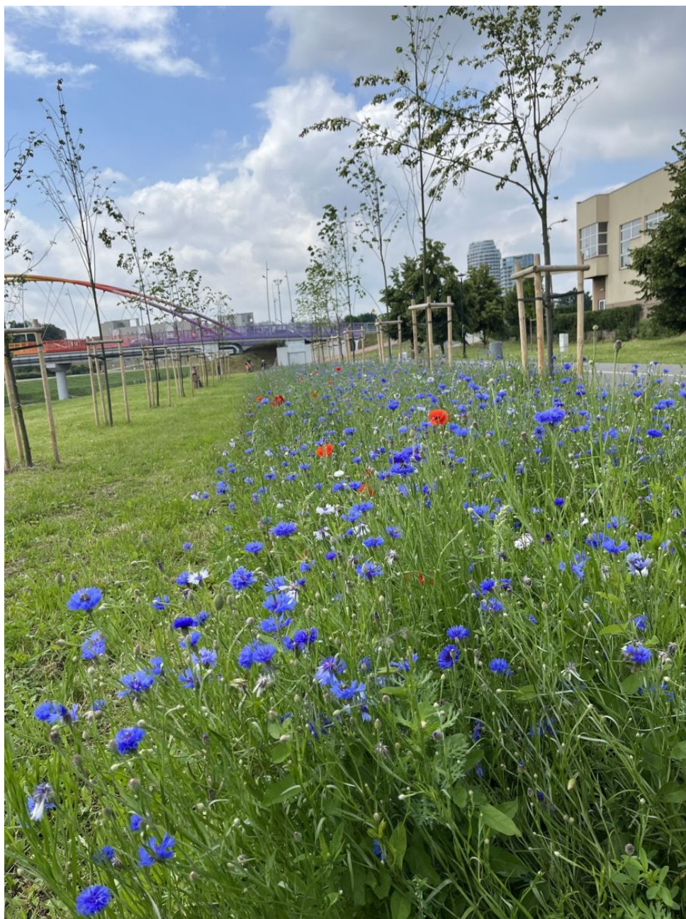
Łąka kwiatna - lewa strona Wisłoka przy Moście Narutowicza

kilkanaście starych drzew owocowych. Pomędzy drzewami uporządkowano teren usunięto starą darni i zasiano trawę. Urządzono łąkę kwiatną, na której zasadzono i posiano gatunki traw i rośliny atrakcyjnie kwitnące.