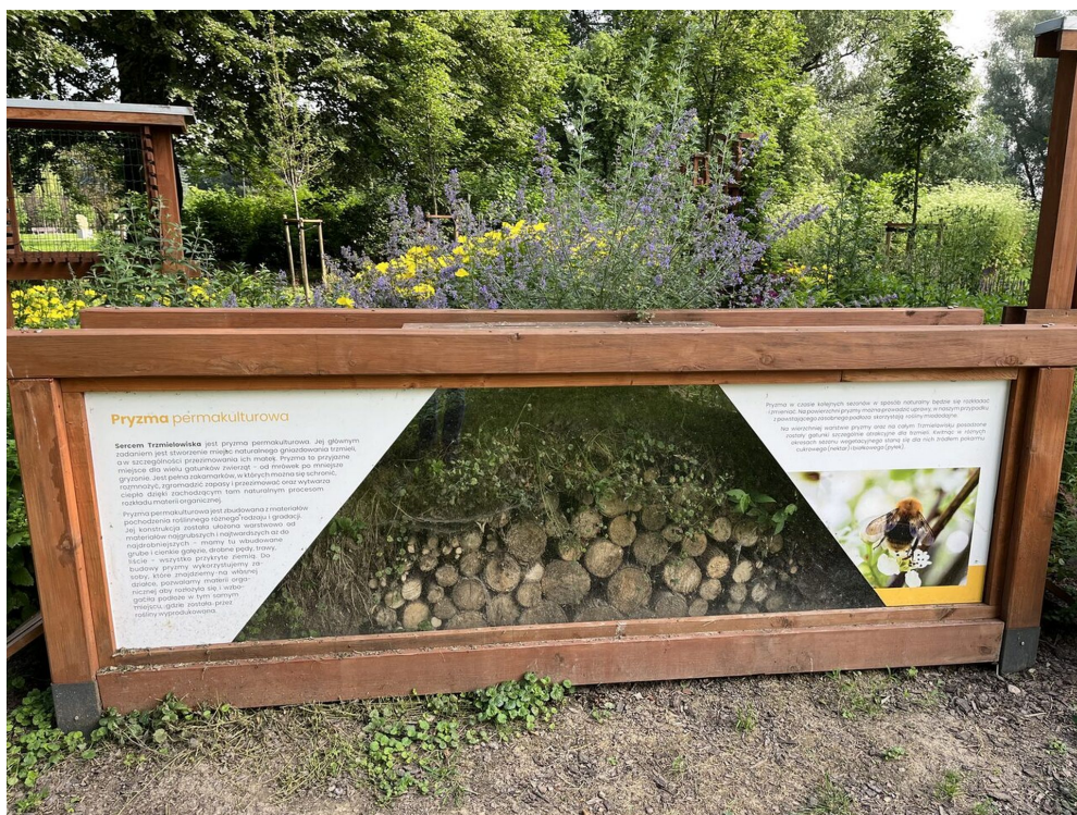
Trzmielowisko na Bulwarach