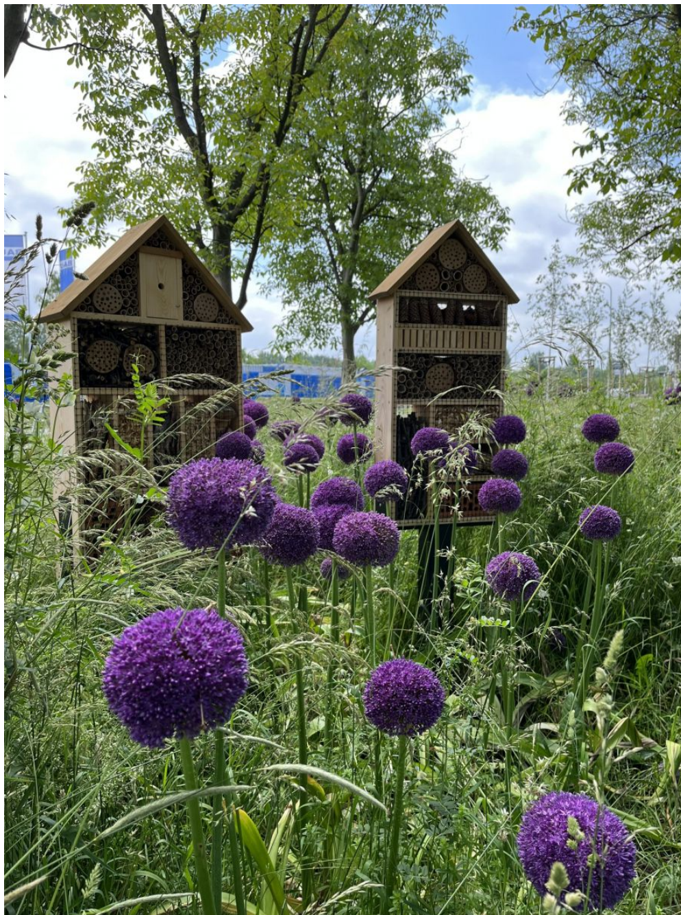
Domki dla owadów przy ul. Wołyńskiej