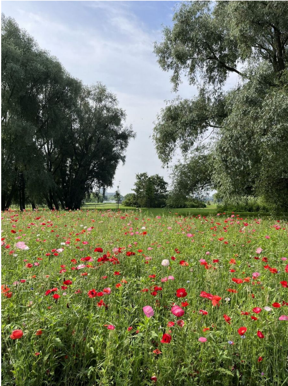
Łąka kwietna na Bulwarach w Parku Kultury i Wypoczynku